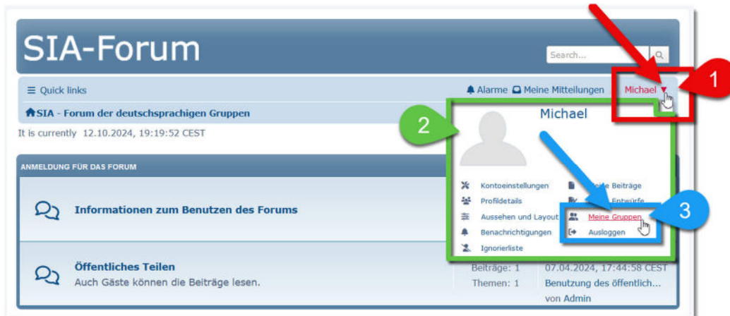
Bild 1.4-1 Der Klickweg, um zu den Gruppen-Einstellungen zu gelangen.